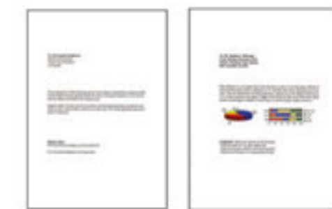
#1 ข้อความสีดำ #2 ข้อความสีดำและกราฟิก

*1 ความเร็วการพิมพ์ (หน้าต่อนาที) ค่ารวมจากการพิมพ์บนกระดาษธรรมดา A4 ในโหมดที่เร็วที่สุด ความเร็วในการพิมพ์อาจแตกต่างกันไปขึ้นอยู่กับวิธีการกำหนดค่าของระบบ, โหมดการพิมพ์, ความซับซ้อนของเอกสาร, ซอฟต์แวร์, ประเภทของกระดาษที่ใช้ และการเชื่อมต่อความเร็วในการพิมพ์ที่ประมวลผลประมวลผลของคอมพิวเตอร์เครื่องที่ส่งพิมพ์