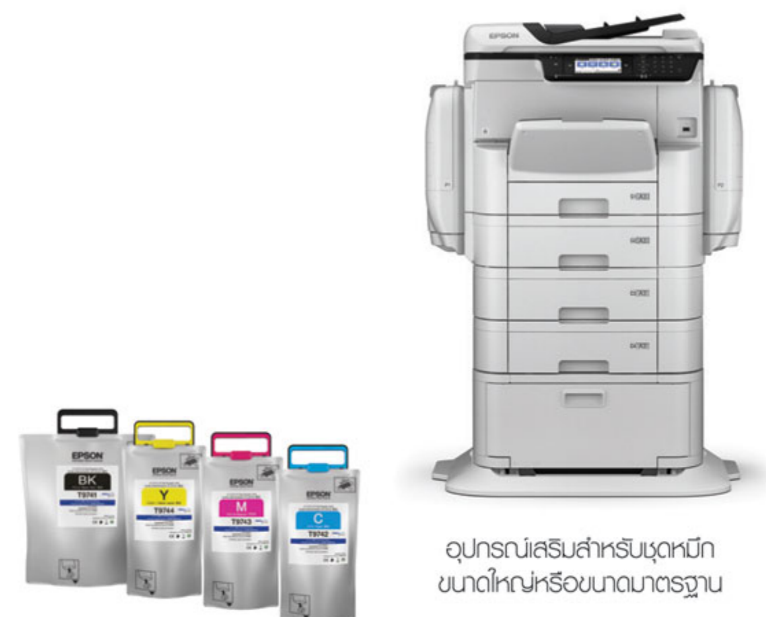
อุปกรณ์เสริมสำหรับชุดหมึกขนาดใหญ่หรือขนาดมาตรฐาน